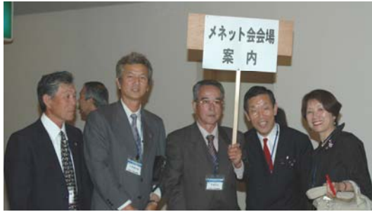
西日本区理事とシャトー会長

ディナーパーティーの会場では大会参加者に特別賞 (ひもの詰め合わせ)の発表やクラブ紹介も行われ ました。