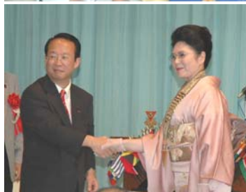
東日本区理事交代式