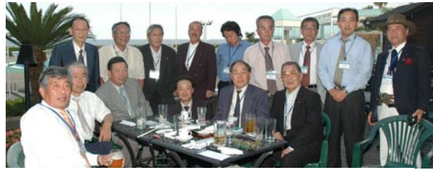
彦根シャトークラブ、下田クラブの兄弟