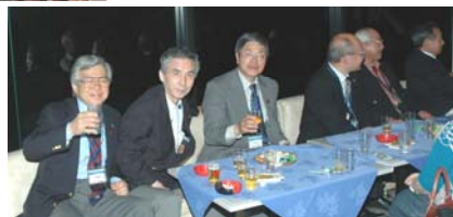
フェロウシップアワー参加者