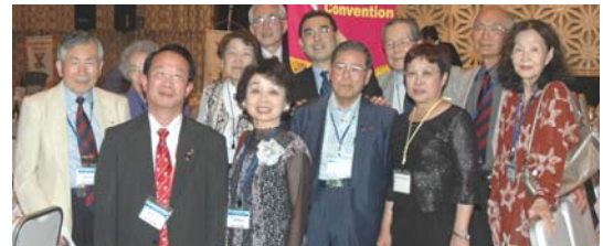
理事を囲んで記念写真