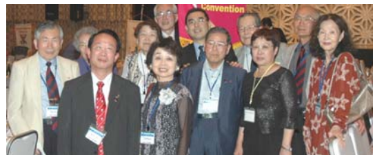
理事を囲んで記念写真