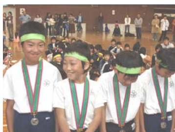
高学年の部準優勝