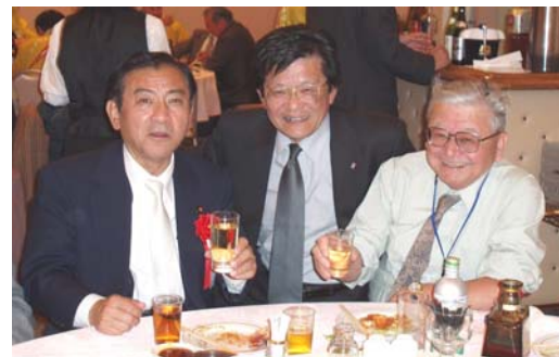
齊藤衆議院議員、久保田Y's、堀口Y's

星陵高等学校吹奏楽部の素晴らしい記念演奏会、第二部の記念例会では檉村ワイズ夫妻への特別感謝状、第三部の懇親会と続き、齋藤衆議院議員始め来賓の方々、東日本区の役員、DBC