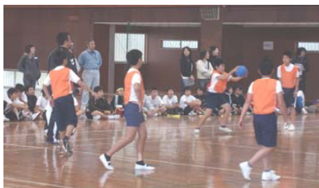
熱戦を繰り広げる選手達

チームもあり、体力的に差があるのでどうなるか心配していましたが健闘していた様です。又、今年はレベル的に均衡していて、接戦が多く延長戦になる試合がかなりありました。高学年のドン！！フ