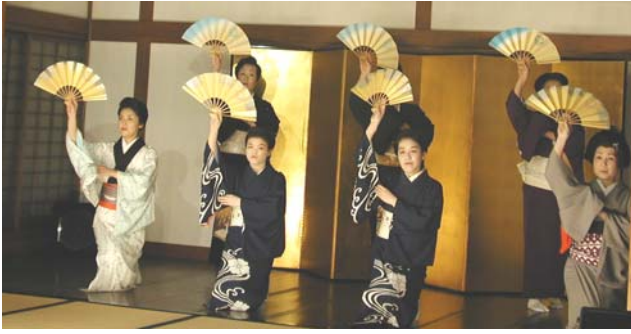
忘年会、新年会は温泉と綺麗どころの伊東温泉へ