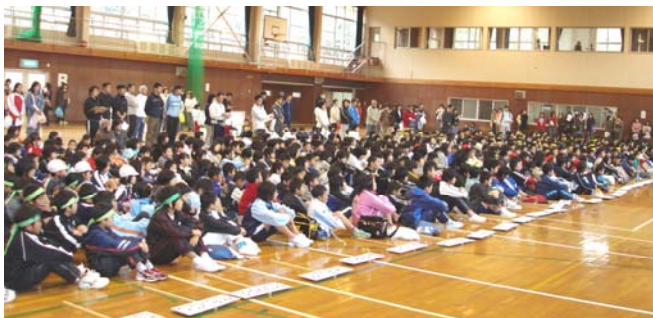
大会に参加した552名の伊東市内小学生

チームもあり、体力的に差があるのでどうなるか心配していましたが健闘していた様です。又、今年はレベル的に均衡していて、接戦が多く延長戦になる試合がかなりありました。高学年のドン！！フ