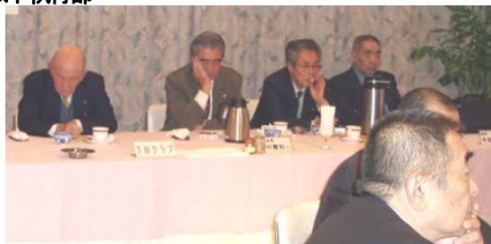
下田臼井会長、執行部