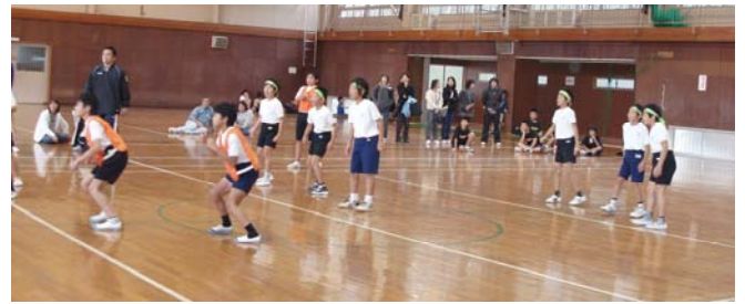
熱戦を繰り広げる選手達

真心こもったカレーも評判がよく、大成功の大会として無事終了する事が出来ました。メン及メネットの皆様、御苦勞様でした。