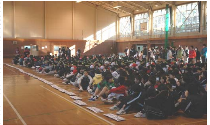
36チーム参加の開会式