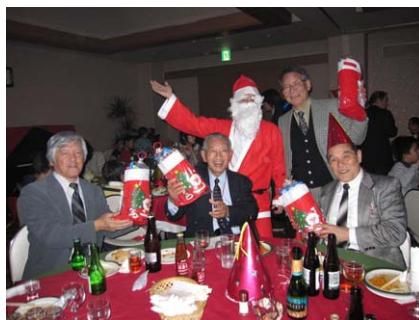
下田クラブもメリークリスマス!

うな状況です。別会場にて非常に簡単な例会(?)も終わり、お待ちかねの【クリスマス家族会】開催です。例年楽しい会のよう