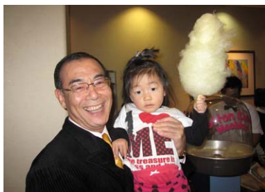
わた菓子にご機嫌

することにしました。(これは大人から子どもまで大人気で、すご〜く嬉しかった…です)本年度の親睦委員会の若手メンバーによりますエンターテイメントに大いなるご期待を頂いております皆様の期待を裏切らないためには何をしようか?等々の検討を重ね開催にこぎつけました。当日若干のトラブルが発生したようでしたが、無事クリスマス家族会を閉会することが出来ました。多くの皆様のご協力に感謝申し上げます。ありがとうございました。