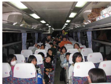
出発を待つ1号車車内

私は、今回のスキーは4回目です。でも、その4回のうち今回が一番楽しかったです。理由は、友達をたくさんつくることができたし、みんな気軽に話しができたからです。スキー場でも、みんなで仲良くすべったり、遊んだりしました。とても楽しかったので、また来年も、このYMCAスキーに参加したいです。このスキーでは、みんなで団体行動をすることで、スキー以外の事もたくさん学ぶことができました。