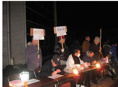
出発受付をするメンバー

ですぐにねむりにつきました。2日目になると中級からはじめていったら、はじめて1度もころばずに行けました。すごくうれしかったです。選手には勝てないけど、自分の目標に勝てたのでよかったです。来年は上級に行きたいです。ワイズメンズのみなさん、来年もよろしくお願いします。