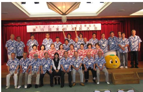
伊東クラブ メン・メネットお疲れ様でした

ことができ(楽しんでいただけたでしょうか?)満足しておりますが、有志メンバーにはこれをきっかけに何か目覚めたものもいるようで...。今後レパトリーが増えるのかも? かもしれません。記念講演をいただいた関口知宏さんにもこの場を借りて御礼申し上げます。ともあれ、2 日間の大会を大きなトラブルなく