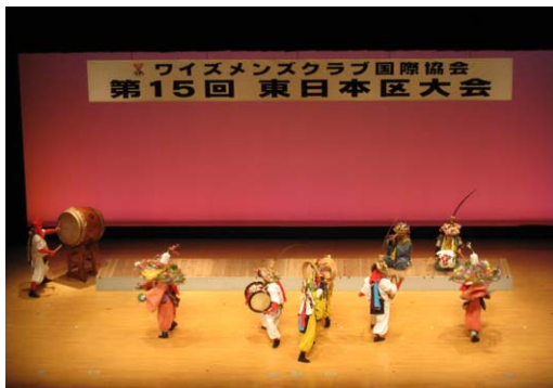
伊東大田楽によるオープニング

ことができ(楽しんでいただけたでしょうか?)満足しておりますが、有志メンバーにはこれをきっかけに何か目覚めたものもいるようで...。今後レパトリーが増えるのかも? かもしれません。記念講演をいただいた関口知宏さんにもこの場を借りて御礼申し上げます。ともあれ、2 日間の大会を大きなトラブルなく