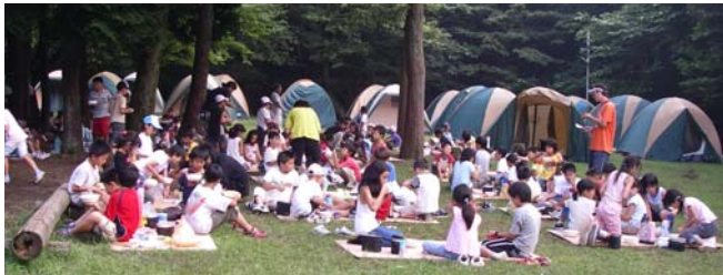
みんなで楽しく夕食

ぼくはこの YMCA のキャンプで一番たのしかったのは、テントをはってテントにねたことです。テントはりは、ほねを組みたてる所がむずかしかったです。みんなでねるのは、少しせまかったです。次に楽しかったのはキャンプファイアーです。キャンプファイアーは夜にやりました。キャンプファイアーには、夏のサンタさんと火の神様が来ました。とくぎなどをみんなでひろうしてとても楽しかったです。