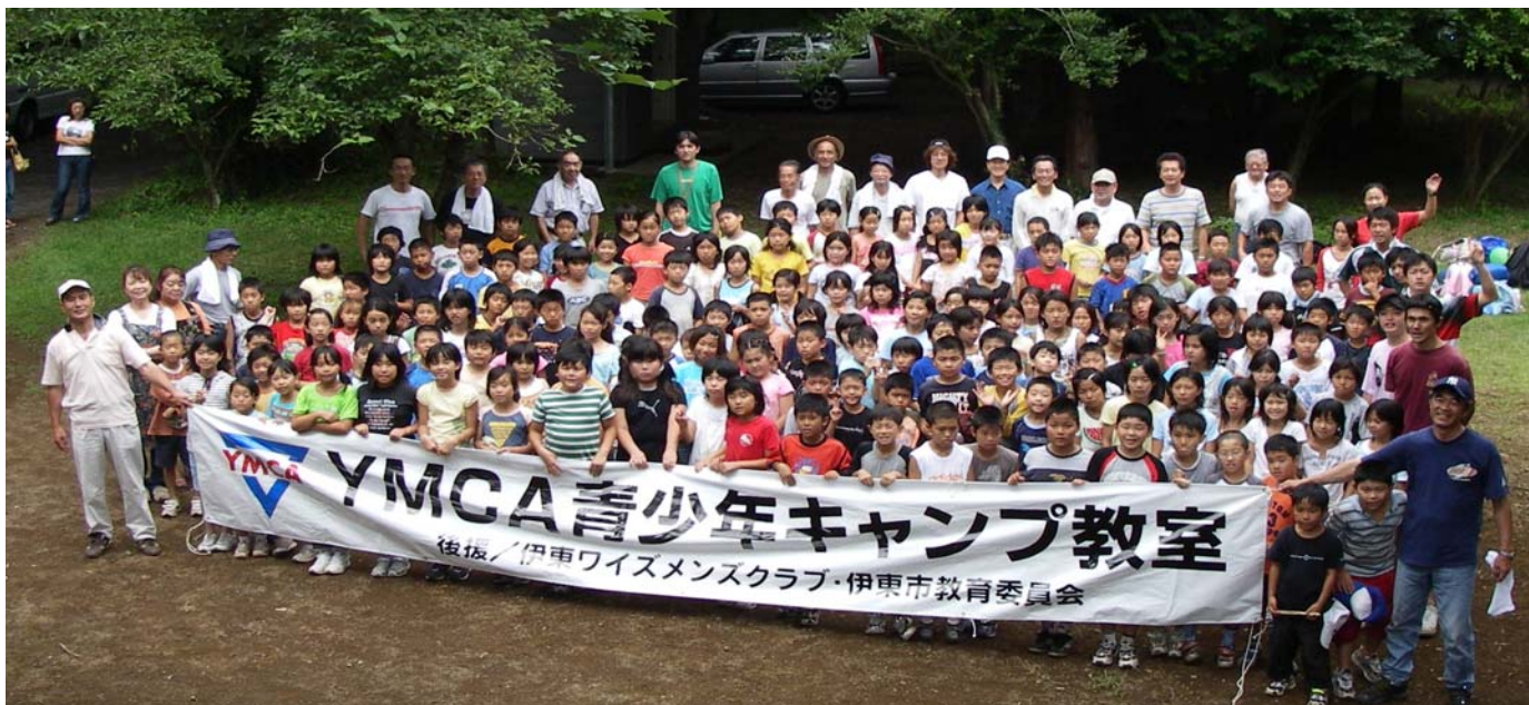
2006 YMCA 青少年キャンプ教室