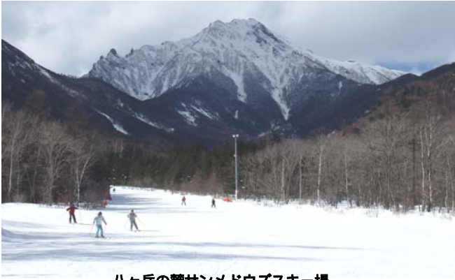
ハヶ岳の麓サンメドウズスキー場

平成 20 年度 YMCA スキー教室は、2 月 16 日、17 日と二日間にわたり山梨のサンメドウズ清里スキー場において、参加者 54 名と、メンバー 12 名、随員 1 名の合計 67 名で実施された。今年は、市役所西玄関が集合場所となり、暗い中 AM5:30 から応援メンバーによる受付が始まった。混雑はしたが、AM6:00 に出発、バスは、例年の通り 3 箇所のドライブインで休憩を取りながら、現地スキー場に AM10:40 頃到着。各自大広間にて昼食をとった後、ゲレンデに向かった。初心者の教室は、PM 1:00 から始まり、インストラクター 4 名の指導により 30 名ほどが、初めてのスキーに挑戦した。例年通り、泣き出す子、倒れたまま起き上がれない子などが続出したが、2 時間の教室が終わる頃には、全員何とか 1 人で滑れるようになり、毎年のこととはいえ、子どもの覚えの早さに感心するのだった。その後は、パトロールをしても問題になるような事件はなく、あっという間に 1 日目が終わった。夜になると、問題行動をおこしがちな大人もなぜかすぐに寝てしまい、例年に無い穏やかさだった。2 日目は、さらに何事もない 1 日で、子どもの人数がそろっているかどうかだけを気にして、帰路に着いたのだった。伊東には予定の時刻に到着。お迎えも間に合い、心からほっとしたのだった。随員メンバーの皆様大変ご苦勞様でした。