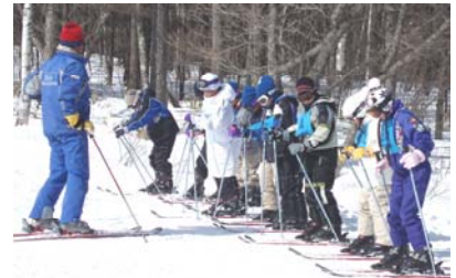
スキー教室まずは整列

今日は、久しぶりにやって最初はこわかったけど何回もやっているうちになれてきてたのしかった。ちがうコースにもちょうせんしたり、たくさんころんでいたのに 1 回もころばなくてすべれた時はすごくうれしかった。リフトもおりの時やのぼっている時はおちないか、ころばないかしんばいだった。上級コースを見ると高くてもいこうとは思わなかったけど、ゆるやかなしゃめんの所ですべてしていると気持ちよかったです。すごくさむかったけど 5 年生になってもきたい。