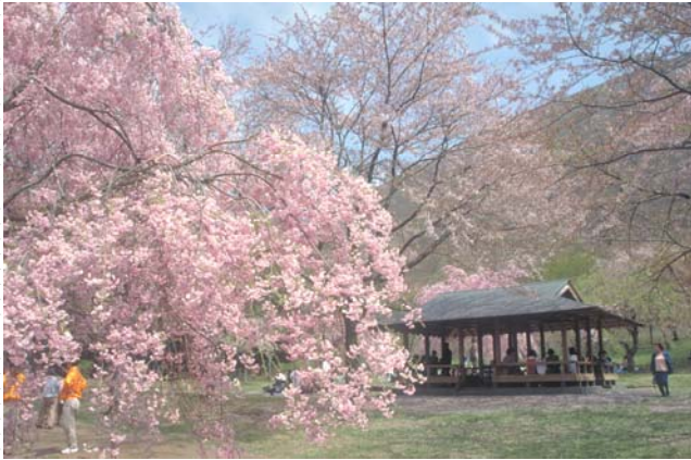
大室山麓 さくらの里