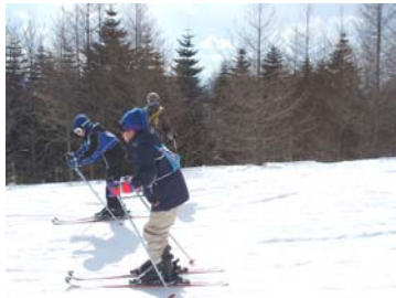
なんとか滑れるようになりました

この日はじめてスキーをやった。さいしょはくつがおもくていやだったけど、だんだんなれてきてよかったと思う。さいしょの時はブレーキがあんまりできなくてころびまくった。なれてきてすべれるようになった。なんとか滑れるようになりました。そして終わった手がつめたくてすぐにはいった。けっこう楽しかった。