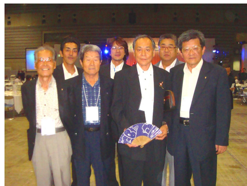
参加者で記念撮影

ワイズメンズメンバー7名で出席してきました。記念すべき日本での国際大会、調べてみると日本開催は22年前の京