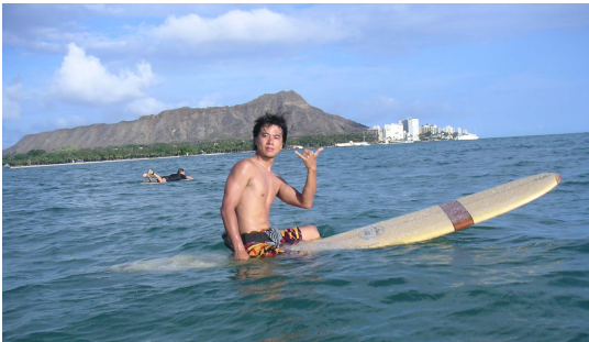
ハワイで購入の宝物と一緒にパチリ

うぜという誘いになんとなく「いいっすねー」といわば社交辞令的な返事。そんなに真剣でもなかったところ、あれよあれよとボードなどを買い（買わせれ？）はまる。数年前にハワイで購入したサーフボードはドナルドタカヤマというブランドの木目調のボードで「板が呼んだのかな？」という感じの一目ぼれ。板の手入れについてうかがうと、手入れというより使用前の準備という感じでワックスというのは足を乗せる部分が“滑らないように”するためにデッキ（表側）に使用するんだそうです。知らなかった。スキーなどとは違うんですね。ちなみに裏側はボトムと言うそうです。ではそんなサーフィンの何が魅力なのでしょう？沖で波を待っていざ波に乗るそのときの海面に近い視点から陸へ向ってすーっと滑っていくスピード感がとても魅力。そして波に乗る瞬間の「すーっと押される（波に乗った?）」という感覚が非常に気持