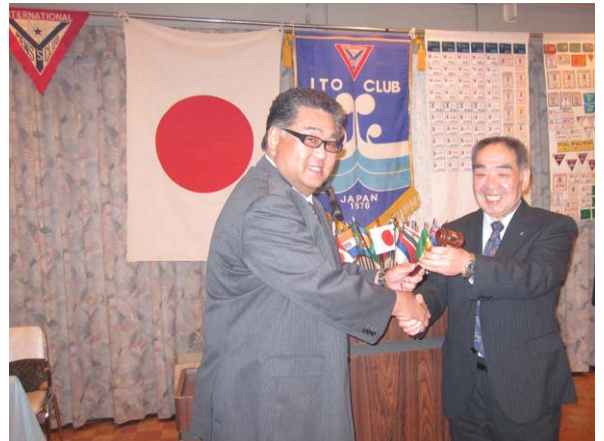
第35代橋場会長から第36代牛田会長へ