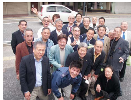
彦根シャトーメンバーと一緒に

クラブがお膳立てしてくださった観光めぐりへ出発! 安政元年創業の酒蔵「岡村本家」では日本酒を試飲し、八日市大風会館では巨大な100畳大風を見学しました。そしてお昼は「レストラン千成亭」で昼食会。彦根シャトーのメンバー12名が出迎えてくれました。口の中でフワッととろけるような近江牛ステーキ、コクと旨味が絶妙の美酒「金亀」をたっぷり堪能しながら交流を深めました。(若干一名、日本酒を堪能しすぎて記憶が飛んだメンバーもいたようです)その後彦根