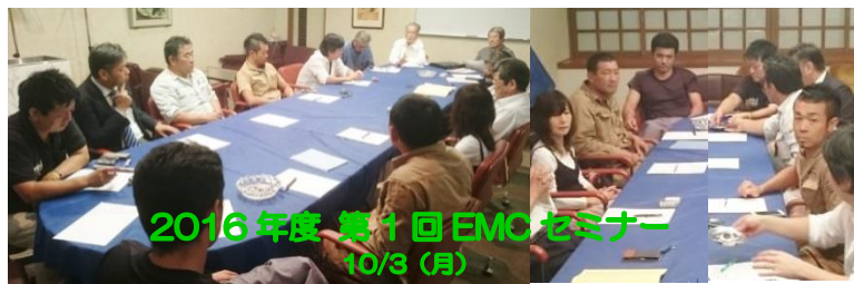
2016年度 第1回 EMCセミナー 10/3(月)