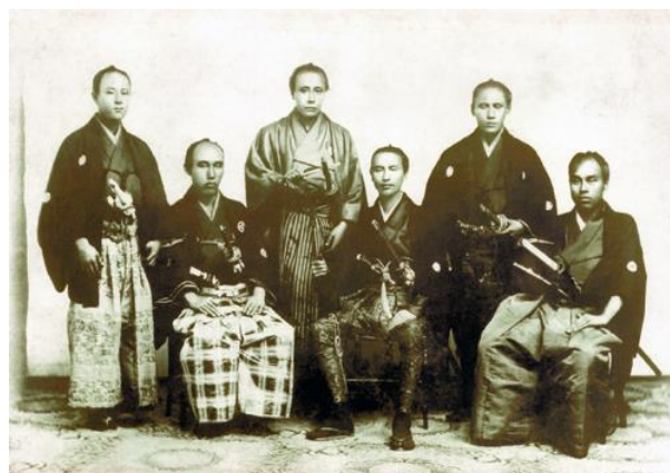
日本の造船の父とも言われている肥田浜五郎氏 (写真、真ん中)